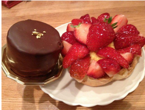
チョコとフランボワーズのムースに、苺のタルト。この前にチョコテリーヌとバニラパルフェもいただいていますw

差し入れていただいた、美味しい苺のお酒を飲みながら、まかない食べて、エリーゼのお菓子も、沢山いただきました♪