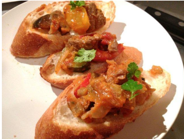
ラムのラタウィユのセブルスケッタ。