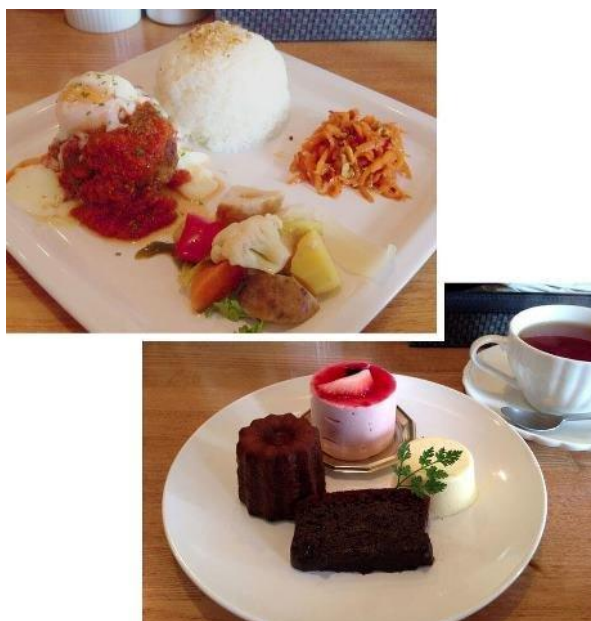
ハンバーグセット&デザート。

14時半からは、おつまみ&ティータイムで、キリン様より協賛いただいた、ラム酒ほかお酒と、おつまみやスイーツで楽しんでいただきました。