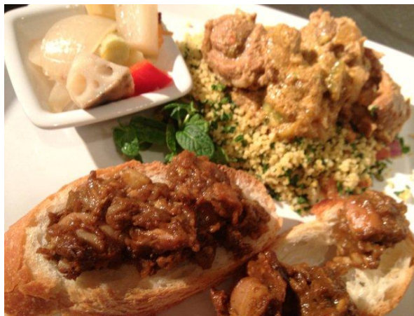
美奈のきまぐれおつまみ盛り。バケットにラムのラギーをのせて焼いたもの、クスクスにラムのココナッツカレー、冬野菜のピクルスなど。