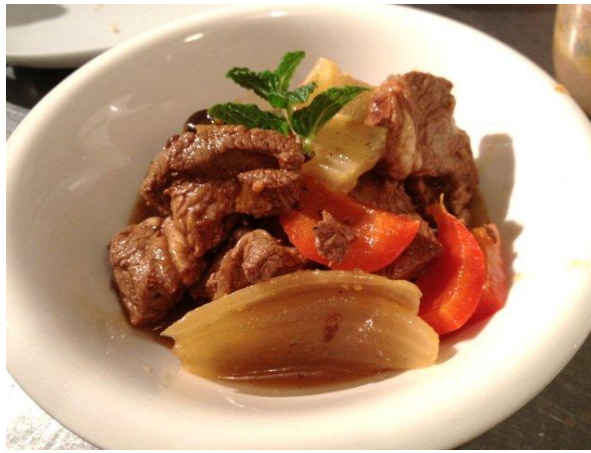
おつまみの、ラムのピクルス。