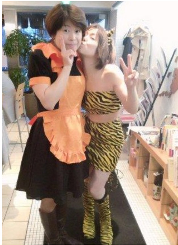
お手伝いしてくれた、バンちゃん、ゆきねえ、どうもありがと う！感謝をこめて、ちゅっw。