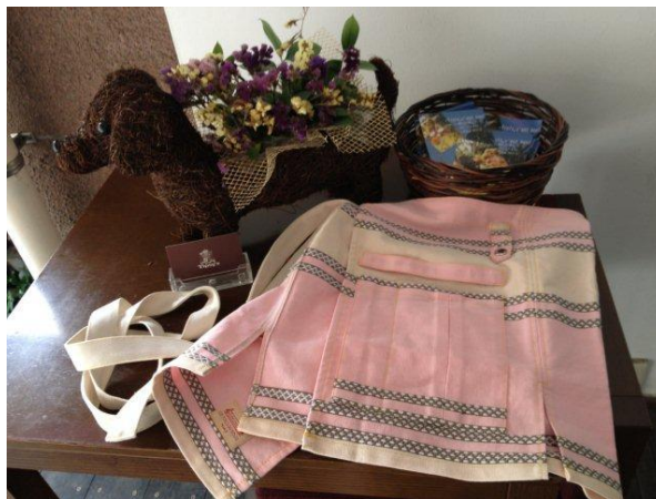
ピンク担当、私のエプロン拡大図wこんなんです。可愛い でしょ？w