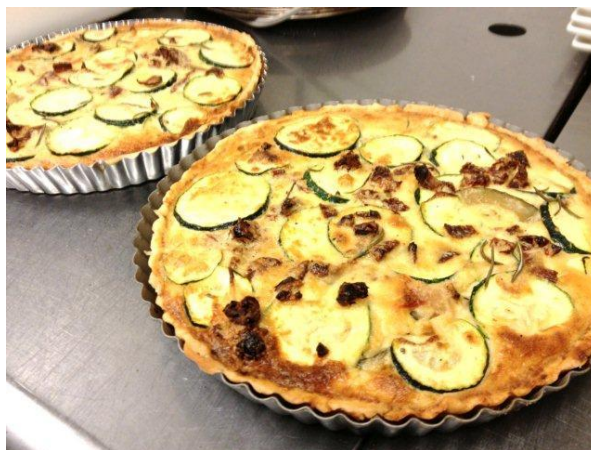
私はお店に着いてからまず、粉を練って生地を作り、キッシュ焼きから。初めての厨房でしたが、広くて使いやすかった！

バタバタしているうちにOPENの11時半。 開店と同時に来てくれた方を皮きりに、 沢山の友達が来てくれて、感激！