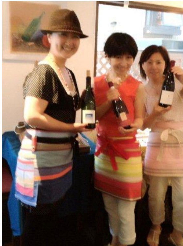
お揃いの南仏エプロンで、5日間、楽しんで頑張りまーす！