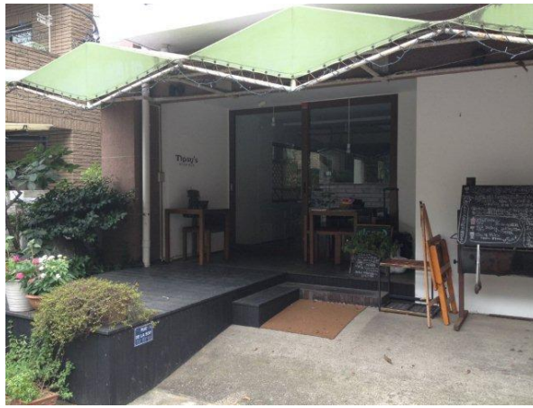
会場のTopsy'sは、茗荷谷の住宅街に佇む、まさに隠れ家BAR。晴れてよかった！