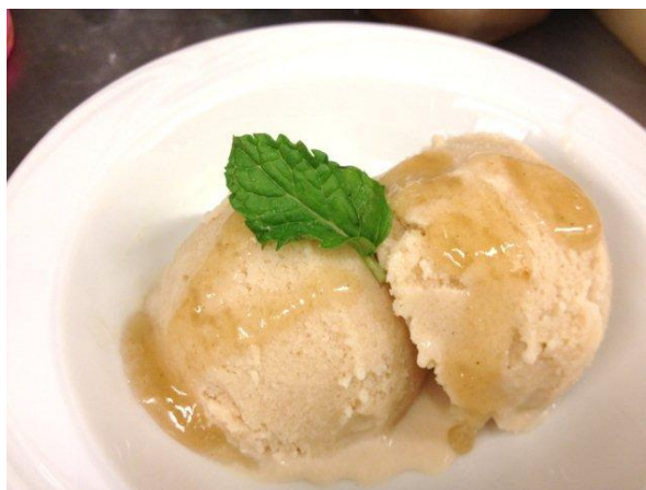
デザートを頼み、これをお代り、というすごい食べっぷりの友達も^^;これは、甘麴と黒糖のジェラート。ランチタイムは2クーポンで300円とリーズナブルw