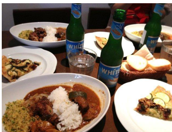
夕方ようやく、みんなのごはん。まかないは、全部盛り～♪ おちやけ付き～♪