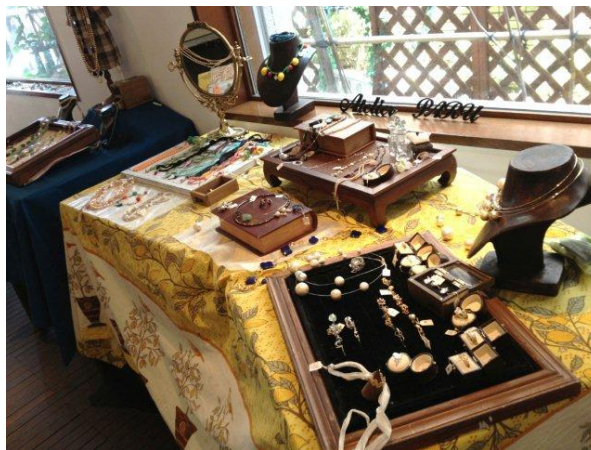
ぱるぱるは、ジュエリーを早速展示。可愛くディスプレイしました♪