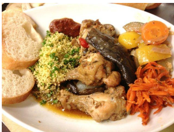
中には、鶏野菜煮込みのあとで、

バタバタしているうちにOPENの11時半。 開店と同時に来てくれた方を皮きりに、 沢山の友達が来てくれて、感激！