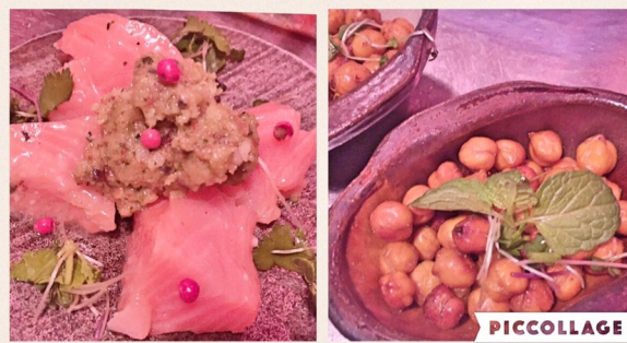
美奈'sつまみは、蟹とトマトのチャトニ風サラダ、サーモンのミキュイ アーモンドとミントと青唐辛子のチャトニ、ひよこ豆のスパイシースナックや、