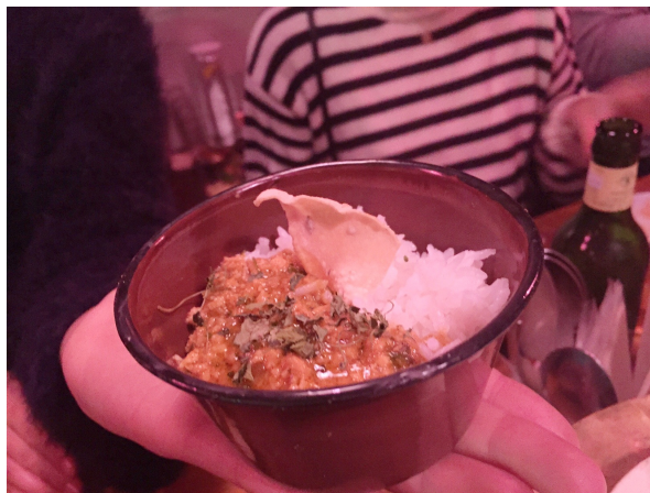
マリちゃん得意のアチャールやバターチキンキーマカリーに加え、