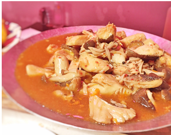
タラときのこのココナツ煮