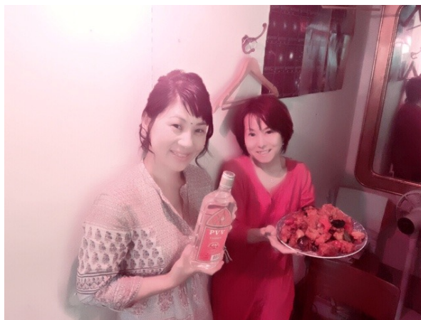
2人のママは、クルティ(インドの衣装)&眉間にビンディまで付けて、ノリノリ♪