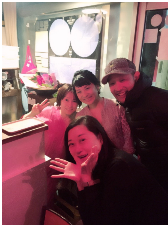
ママと一緒に飲んで笑って、めちゃめちゃ楽しかった！