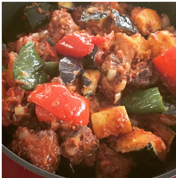
画像は、仕込み中の、野菜たっぷり南インド風豚豚。スナックといえどガッツリフードも用意しましたwスナックだけど、チャージなし、つまみも300～500円と、採算度外視の良心的下北価格に設定！