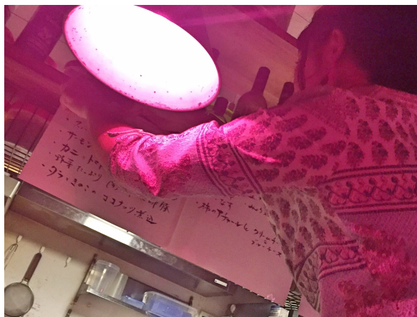
壁によじ登ってメニューを貼る、勇ましいマリ店長w