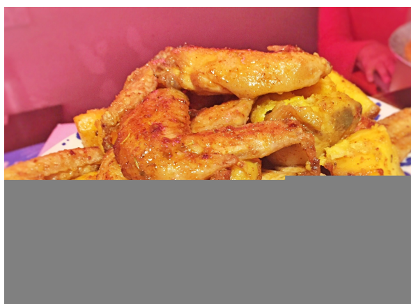
スパイシー揚げ鶏