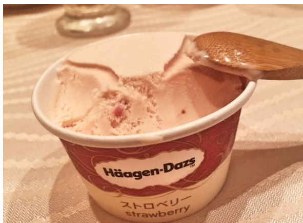
ハーゲンやらで、充実のデザートタイム。