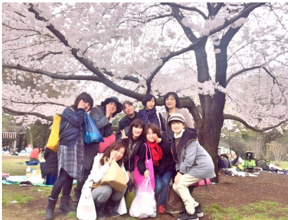
楽しいお花見でした！