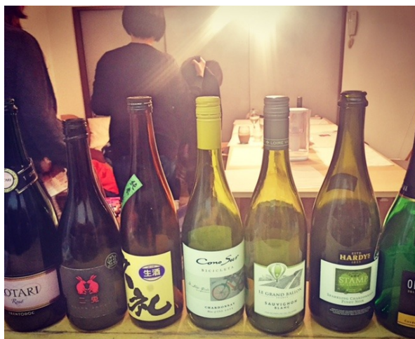
最終的に8本空いたかなあ^^;