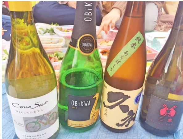
泡、白、日本酒、、、とおちやけも進みます♪