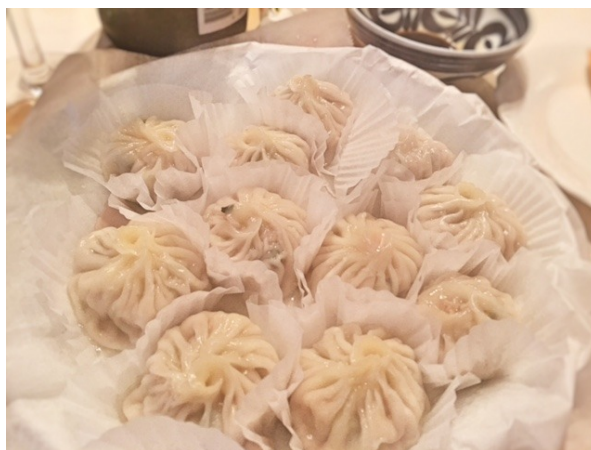
蒸したて手作りショウロンポウやら焼き立てパンやら、も新たに登場し。