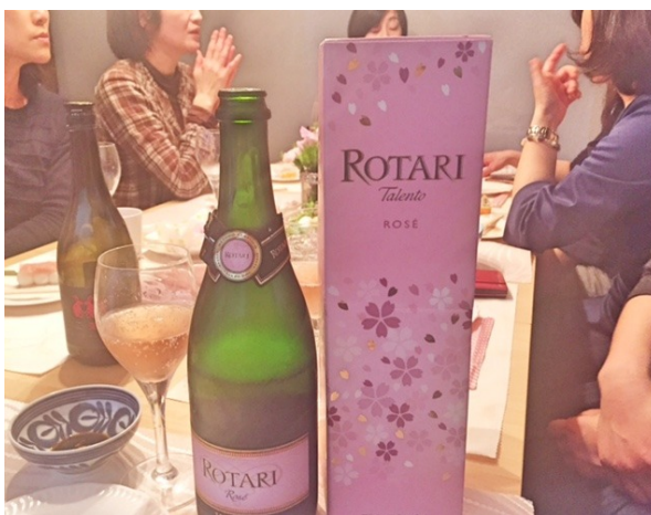
こちらの桜BOXのロゼスパークから、仕切り直し♪