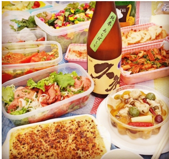
みんなの持ち寄りも豪華！