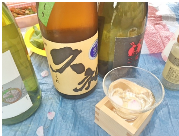
おちょこに花びら、、、きゅん!