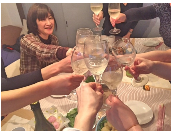
寒くなってきたところで、いつものように場所を移して、我が家で二次会♪