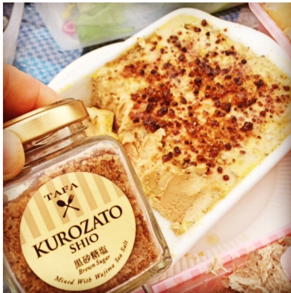
私は、フォアグラテリーヌにわじまの海塩の黒糖塩をふって、、、