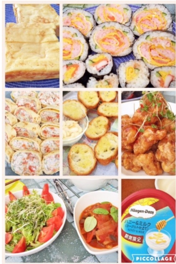
巻物番長の、見事な薔薇の飾り寿司ほか、お肉、魚介、野菜、デザート…とバランス良く集まりました！