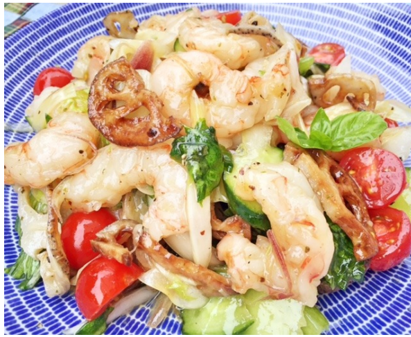
私は甘海老と新玉ねぎと蓮根のマリネに