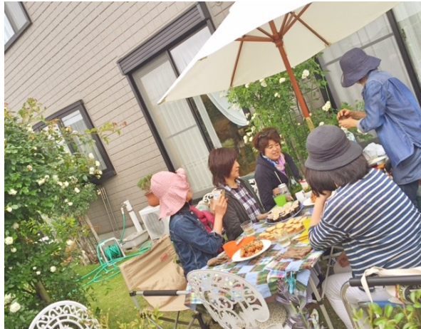
薔薇の中でいただくお料理は美味しい！