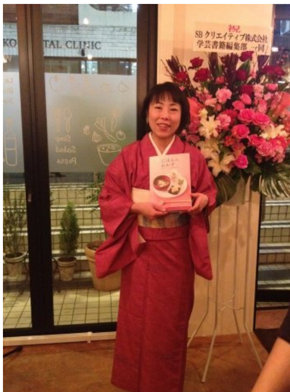
いこまんだむの温かいお人柄おふれる、とっても素敵なパーティーでした♪