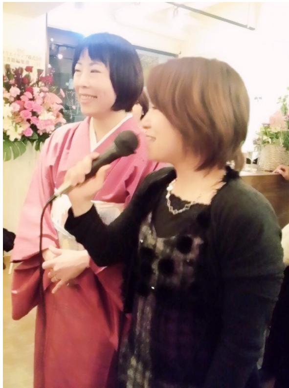
私は、いこまんだむと結成している?!「おちゃけの会」代表として、僭越ながら祝辞をのべさせていただきました。