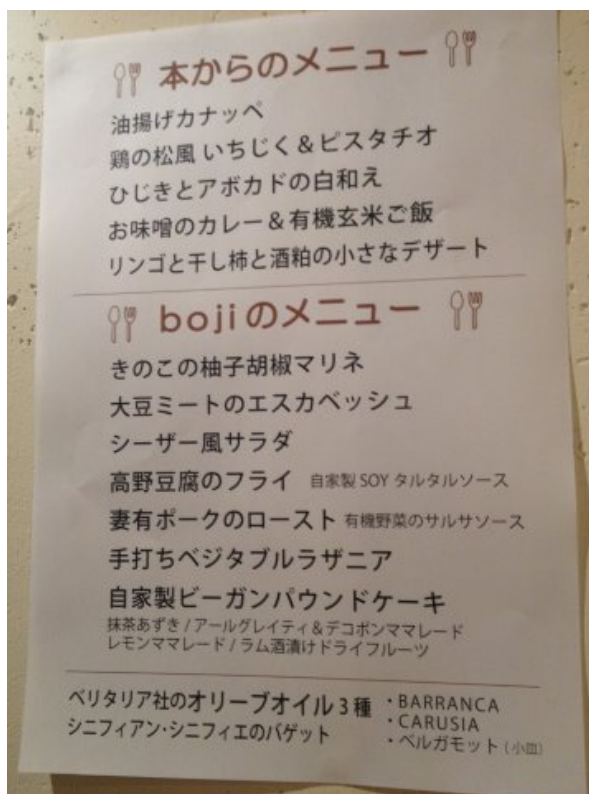
お料理は、会場であるお店、赤坂のbojiさんオリジナルメニューとレシピ本からのものと半々。ガッツリいただきました！