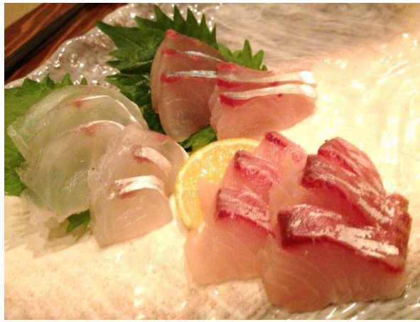
朝獲りのコチ、シマアジ、ボラの昆布シメ。どれも新鮮で美味！