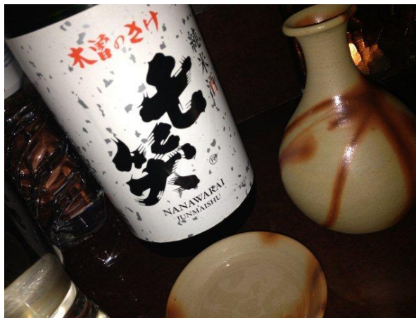
そして、ついに禁断の日本酒にw

あっという間の4時間半。 BARは時間を忘れさせるから、恐ろしい。 いっぱい食べて飲んだ、楽しい夜でした！