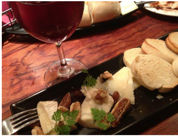
チーズとドライフルーツの盛り合わせ。赤ワインを空けた後は、サングリアと。フルーツの風味が程良くでた、サラッと飲みやすいサングリア。