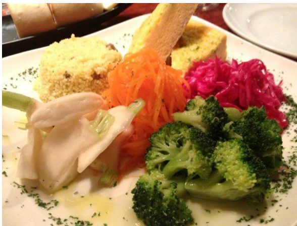
前菜盛り合わせ。はちみつでマリネしたカブにキャロットラペ、赤キャベツのマリネ、フリッタータ、ブロッコリーのアンチヨビソテー、クスクスのカレー風味。バランス良く、食欲がすすむ冷菜盛り。