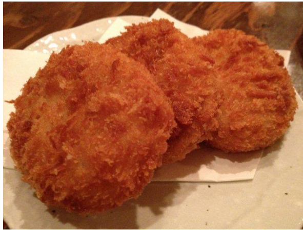
里芋コロッケ。サクサクで噛むとねっとり。甘くてじゃがいもより美味しい～