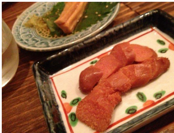
たらこの燻製。これが、この日のスーパーヒット。里芋のから揚げと一緒にいただくと、また格別。後ろにあるのは、甘辛く後をひく、長芋のたまり漬け。