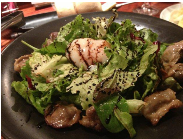
砂肝と半熟卵のサラダ。大ぶりの砂肝は柔らかくぷりぷりとジューシー。その脂のしみた葉野菜に半熟卵をからめると、バルサミコ酢の甘酸っぱさとまじりあって、まろやかなハーモニーに。