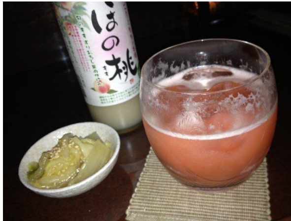
飲み足りない酒豪相手と、和酒BAR KATALで二次会。