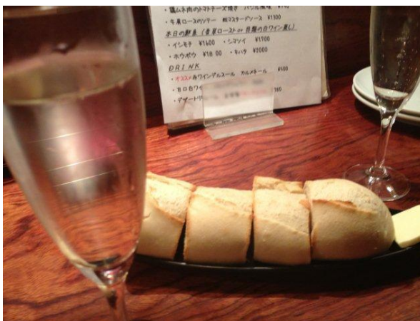
突き出しはもちふわのパン。樽出しスパークリングで乾杯！