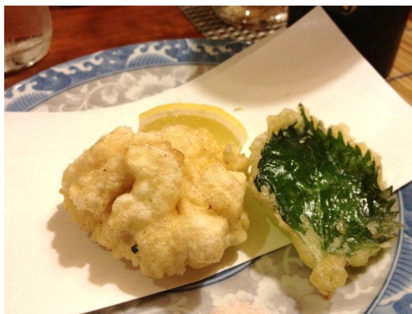
白子の天ぷら。とろとなめらかで、素晴らしくクリーミーな白子に悶絶。