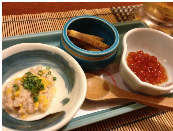
前菜3種盛り。ヒットは左の、蟹と牡蠣の和えもの。