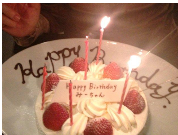
小学校の時の呼び名「みーちゃん」と書かれたプレートが、泣かせますw