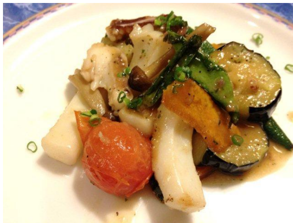
スミイカと野菜のバターしょうゆ炒め。ごはんもお酒もすすみますw揚げ茄子にしみたイカの旨味がたまりませんw