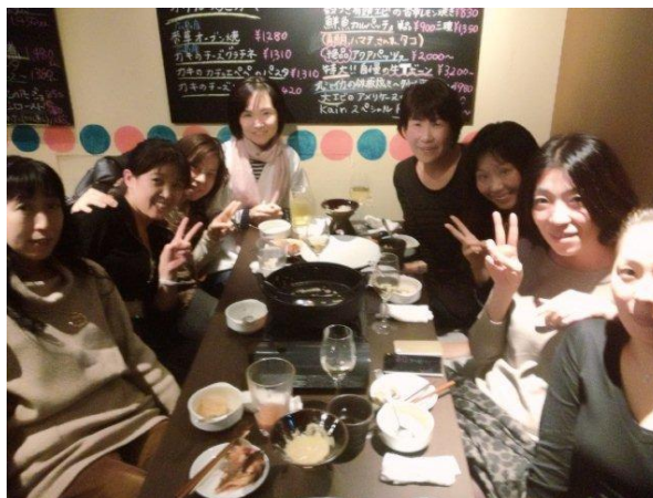
私が最後の誕生日だったらいい。これでみんな、おない年w

気がつくとみんな、あの頃のおてんば少女たちに戻って 大はしゃぎの夜。 あっという間の終電でした。