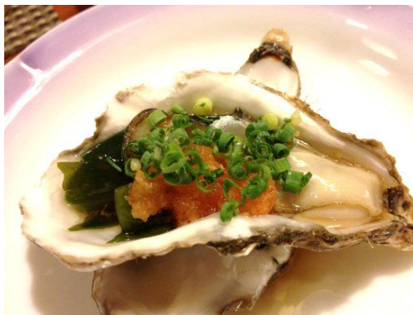
生牡蠣。ちゅるりんとミルクィな岩牡蠣です。