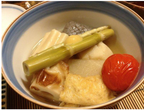
お野菜炊き合わせ。関西風おでんっぽい感じ？ちくわぶが地味に美味w