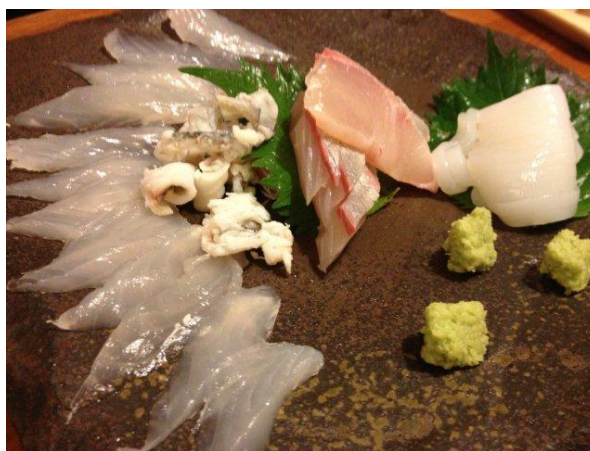
カワハギ、カンパチ、スミイカのお造り。どれも新鮮びちびち。特に弾力と甘みのあるスミイカが美味しかった。