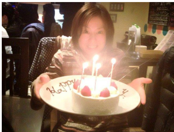
ありがとー！思いがけないサプライズに感激。