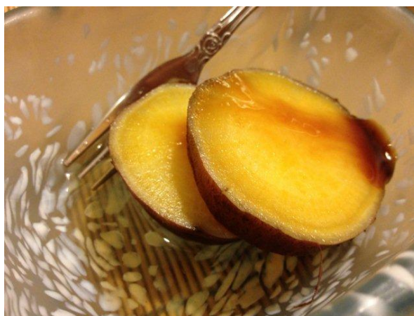
さつまいもの蜜煮で♫。

日本酒も美味しかったけど、久しぶりに飲んだ伊佐美のお湯割も美味しかったな。 アキラシェフ、ご馳走様でした！