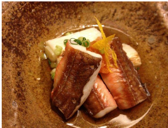
ヤガラと長ねぎ。ぷりぷりのヤガラに香ばしく焼いた甘い葱のマリアージュ。