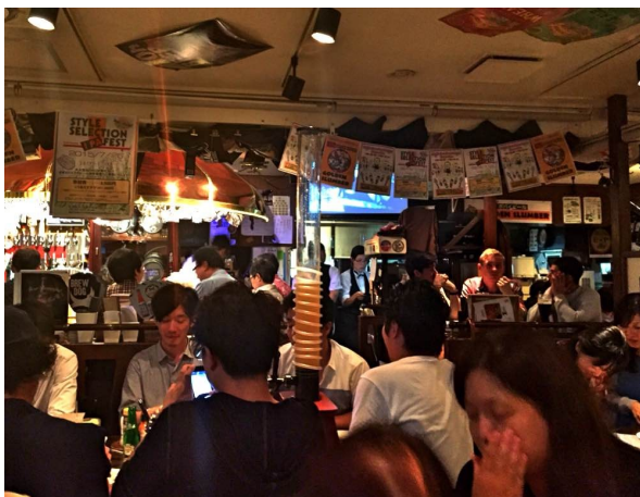
店内は今日もあふれんばかりの満席でした！