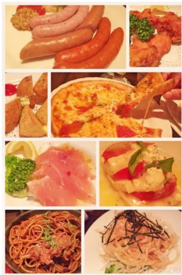
20時まではハッピーアワー。王冠のついたビールを選ぶと、なんと1つにつき1つ、王様メニューのハーフサイズがついてくる！8種限定なので、どれも2、3周食べちゃいました！（それだけ、飲んだということ?!）