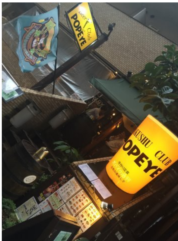
レストラン☆居酒屋/ダイニングバー/カフェ