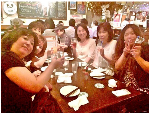
大満足！の皆の笑顔wここは3の倍数で来るのが、王様フ ードの効率よいw