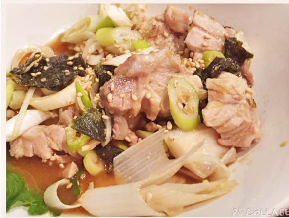
ちょっと変化球で、本マグロ切落しの雲丹醬和えに、腹身の筋にネギや海苔を和えた「スジポン」。