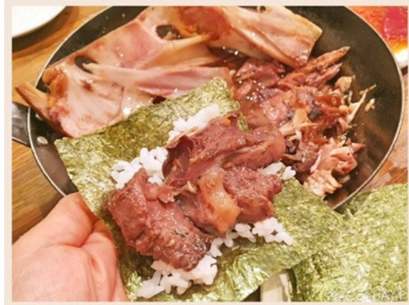
こちらも、ほぐしてからの～手巻き寿司に～♪