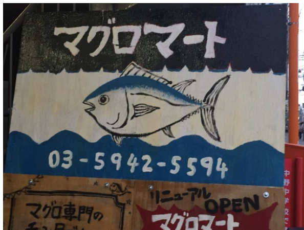
マグロ好きにはおすすめです！予約はお早めに♪

これでもかといくらい、マグロ食べました！ う～ん。しばらくマグロはいいかな^^;