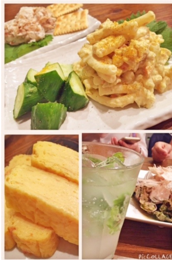
日本酒モヒートで乾杯してからの、まずは軽くツナのポテトサラダ、ツナのカレー風味マカロニサラダなどなど。