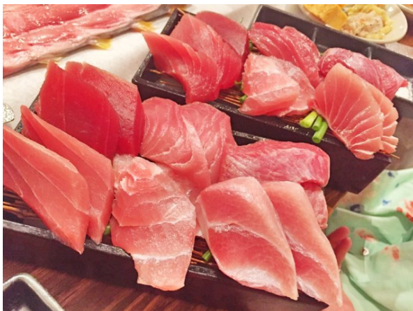
赤身、中トロ、脳天、頬、ハラミ、カマトロのメバチマグロの6つの部位の食べ比べができる刺盛り、マグロ箱はなんと500円！