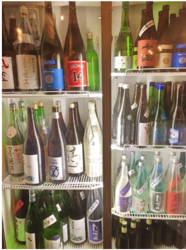
日本酒もけっこうあるのが嬉しい！