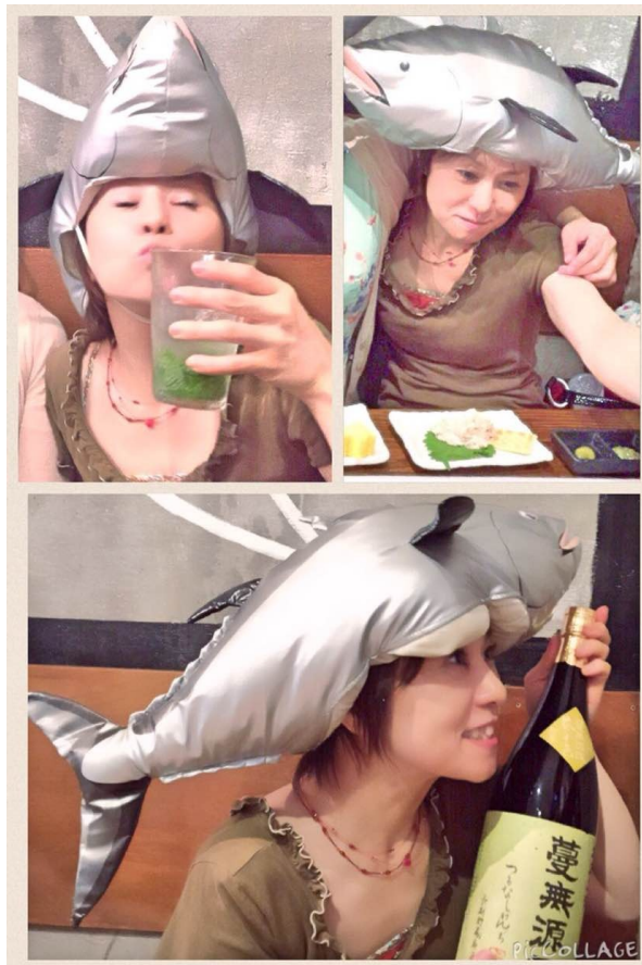
マグロコスプレも、無料ですw