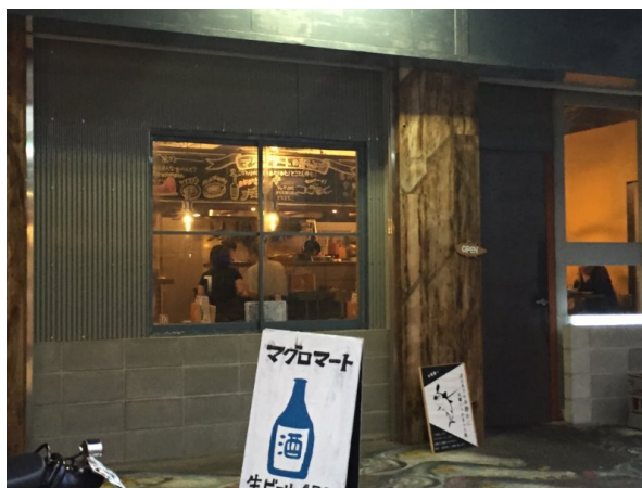
中野駅から、商店街を抜けて10分弱歩くと突如現れます。