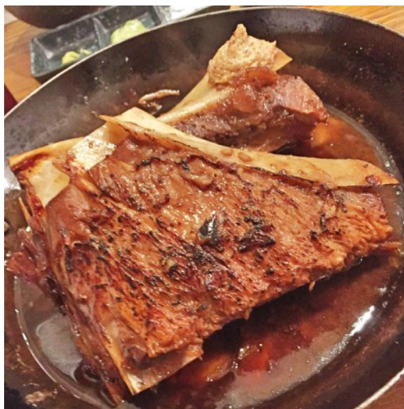
フライパンごと男前にどどん！と出されるバーベキュー風味の「マグロのカマスペアリブ」。これ、ニクニクしくて非常に美味しかった！