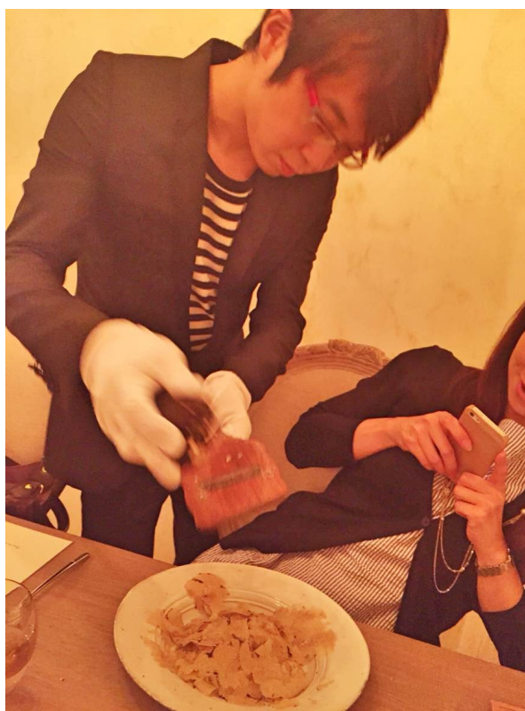
来栖さんの手で、これでもかとふんだんに削られていきま す。テーブルに飛び散る豪快さが素敵♪