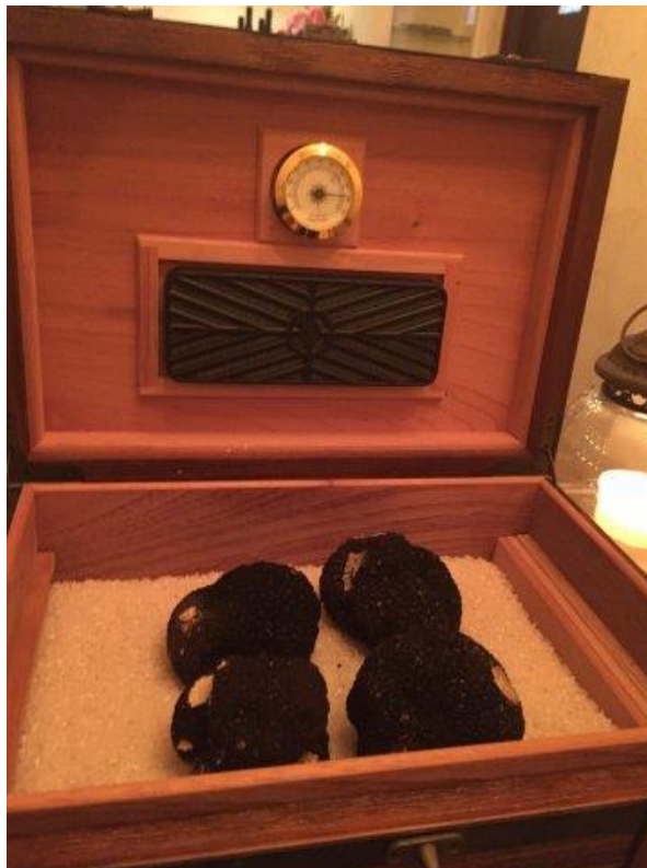
恭しくあげられた箱に鎮座します、このトリュフが、、、

★ボニユでパースデー☆ | MINA/sweets lotus 使わず、濃厚なフォアグラの旨味を最大限に活かしていま す。