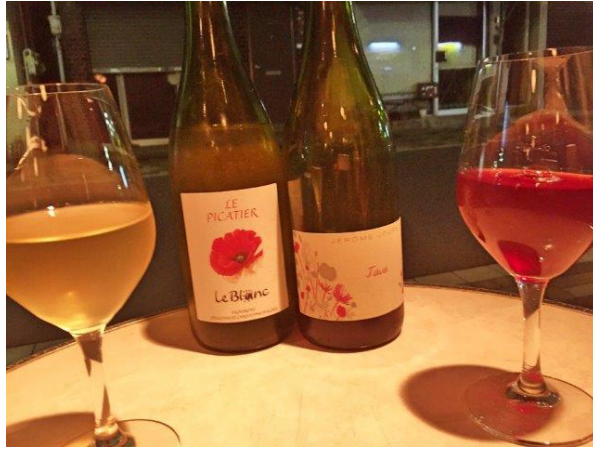
盛り上がり、お店でしてから歩いて代々木上原の2人の好きなワインバー、ル・キャバレーへ。

一杯ずつ飲んで、常連さんと話したりしてたら、あっという間の終電タイム！ 久しぶりに走りました(笑)