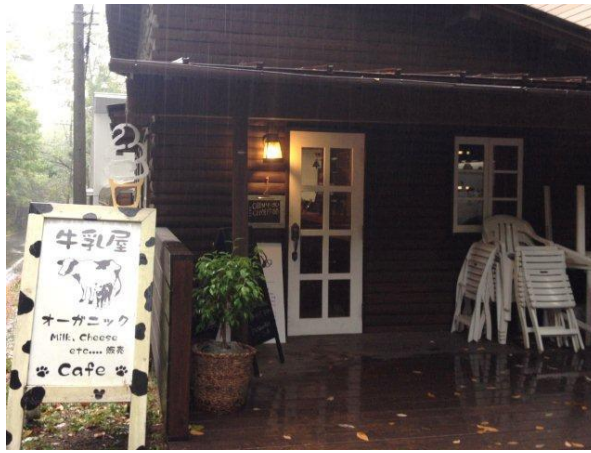
手作り感と木の温もりのあふれる、可愛いお店でした！