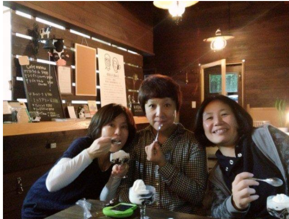
友達オススメのコーヒーゼリーにしました。