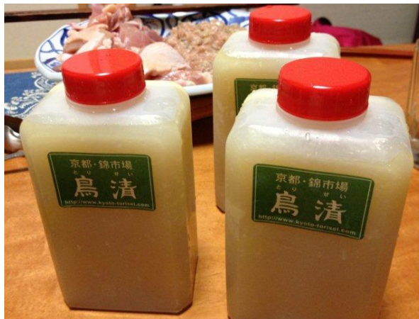
京都の鳥清さんからお取り寄せの絶品、鶏の水炊きセット。 この出汁が絶品なのです！