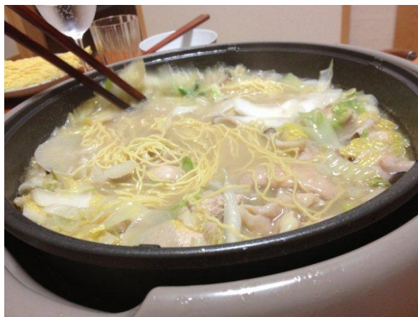
ラーメンがまた、最高〜。このスープに恐ろしい程合います。お腹いっぱいでもするする入っちゃう！