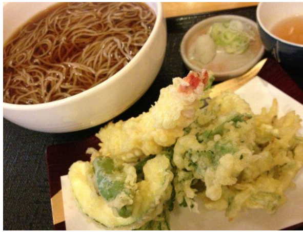
軽井沢に着いたところで、まずはボリュームな天ぷらそばランチで、腹ごしらえ。