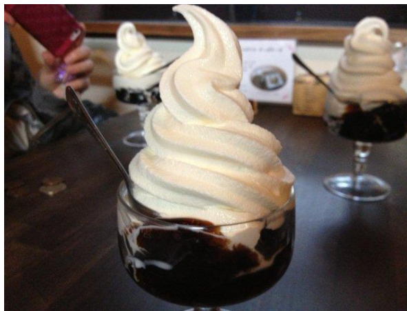
珈琲の苦みにとってもミルクィなソフトが見事にマッチ！

夜は、友達夫婦の心尽くしのおもてなし。 海老のアヒージョに無花果の白和え、 蓮根のキッシュに里芋含めにのから揚げおろしがけ、 さつまいも、蓮根、海老の天ぷら盛り合わせ、 にんじんのナムル、春菊のサラダなどなど、、、 お料理上手な友達の手料理をたんまりいただきました。