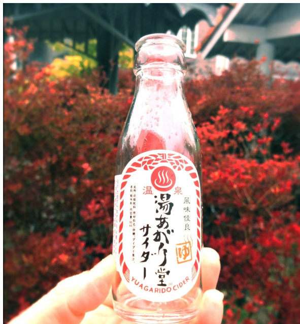
紅葉が、ちょうど良いシーズン！

おやつは、牛乳屋さん (Click!) の、 10月末まで限定というソフトクリームを食べに。