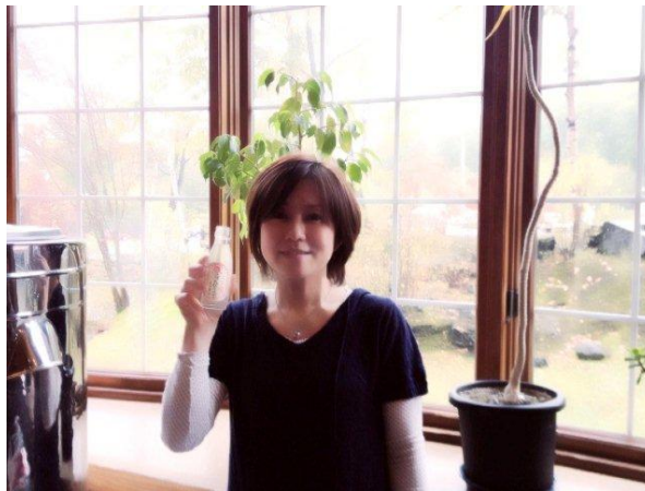
この日は寒かったので、とりあえず温泉へ。スッピンで湯上りサイダー、美味しかったw