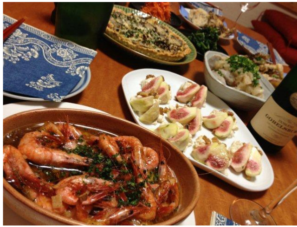
私の大好きな海老と蓮根がたくさんあり、さりげない思いやりを感じました。ありがと〜！！