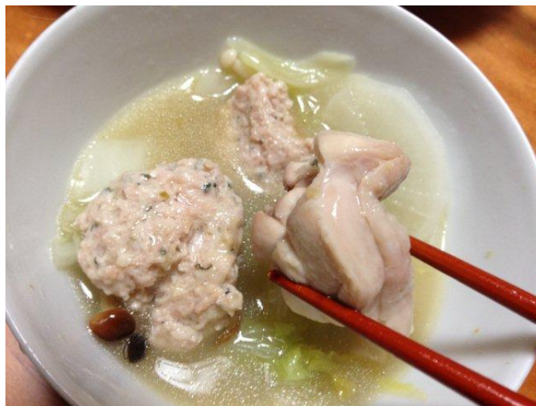
ぷりぷりの鶏肉にジューシーな鶏団子。柚子胡椒を加えるとさらに美味しさアップ！