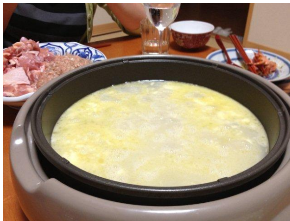
ミルクィで鶏の旨味あふれる上品でクセになるお出汁です。