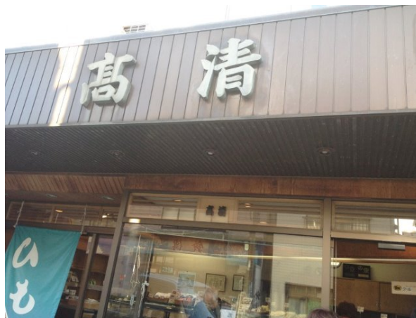
まずは、友達の実家のやっている美味しい干物屋「高 清」さん本店へ！