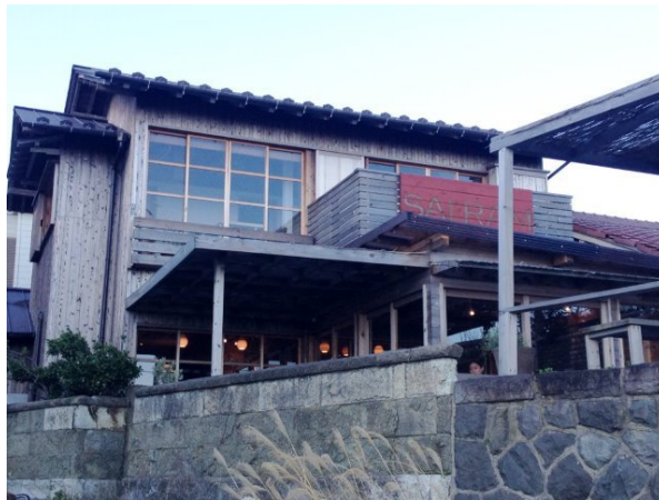
真平と金太郎が結婚式の打ち合わせをしたカフェ、SAIRAM を通り、、、