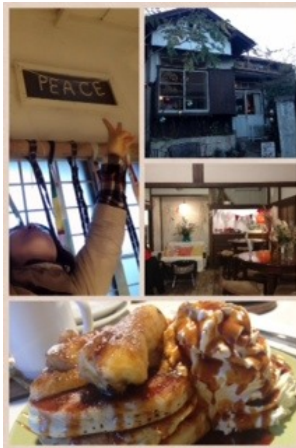
カフェ ナガクラとして登場した「カフェ坂ノ下」で、バナナキャラメルパンケーキ♪PEACEの個室を使わせていただきました！