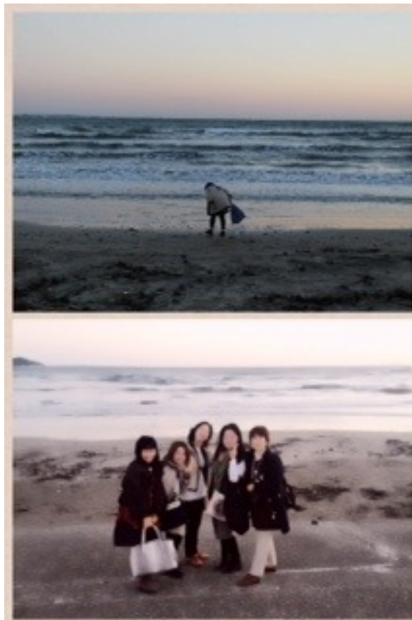
和平が桜貝を拾っていた由比ヶ浜で桜貝を探し(もちろん季節柄なかったw)、