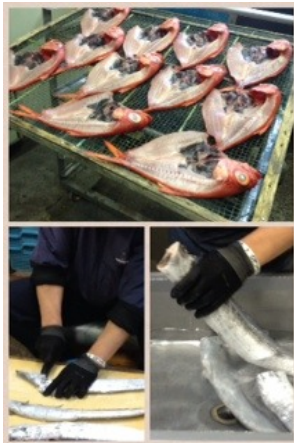
事前をお願いしていた作業場の見学とお買い物。