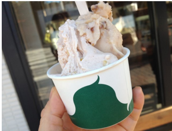
14時に江の島に集合し、The Market SE1でジェラートを食べて景気付け！イチジクとカマンベール、マロンと和栗の2種。