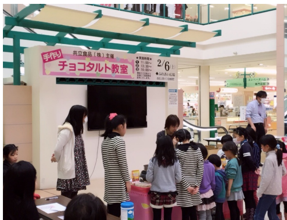
子供たちも、熱心で可愛かった！