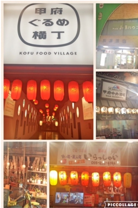
甲府は、本当に魅力的なお店が多くて、次回はここも来たい、あそこも行きたい、と夢ふくらみます！