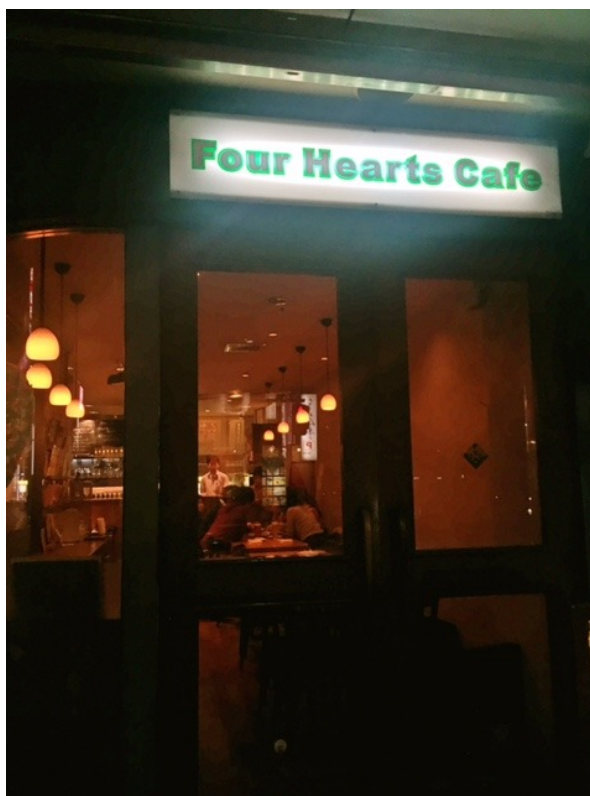
終了後は、昨年も訪れた、甲州ワインと地野菜と山梨グルメで打ち上げ。