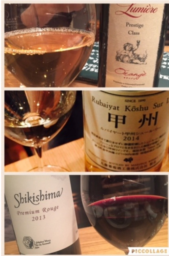
国産ワインも、もちろん堪能！やっぱり甲州ワインは赤より白かな・・・